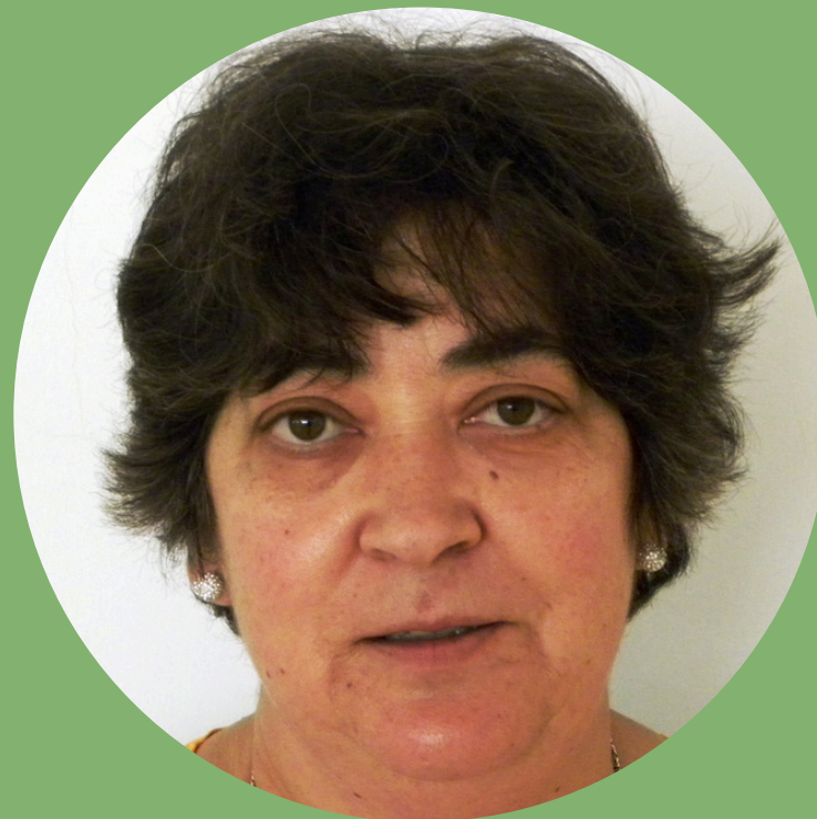
Por una vida llena de recuerdos.