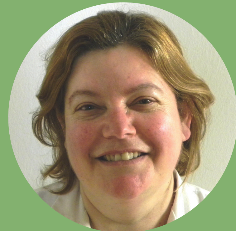
Por tantos años de compromiso.