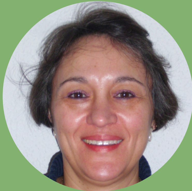
Por su dedicación y entrega.

¡Gracias por tantas décadas de paciencia, dedicación y por dejar una huella tan bonita en nuestras vidas!